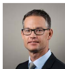
Patrick Erne Leiter Research

Alternative Strategien, welche weniger mit den Zins- und Aktienmärkten korreliert sind, bieten für die nächsten Monate nicht nur attraktive Renditemöglichkeiten, sondern leisten auch einen wichtigen Beitrag zur Portfoliodiversifikation. In den 70er Jahren gab es ausser Gold kaum Alternativen zu Aktien und Anleihen. Heute stehen verschiedene alternative Anlagestrategien zur Auswahl, die ein traditionelles Portfolio gerade in Stressphasen und anhaltenden Bärenmärkten diversifizieren können. Wir empfehlen, einen Teil der Zins- und Aktienrisiken zugunsten von Alternativen Anlagen zu reduzieren. Die besten Ideen in diesem Bereich finden Sie auf Seite 6.